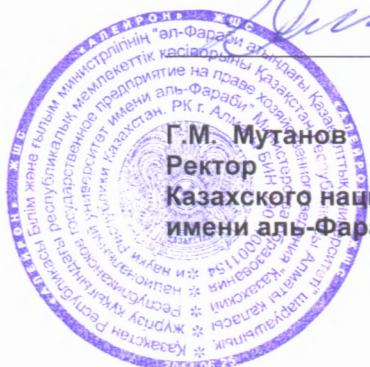
Г.М. Мутанов Ректор Казахского национального университета имени аль-Фараби

Меморандум составлен в четырех экземплярах на русском и английском языках, имеющих одинаковую силу, по одному для каждой из Сторон.